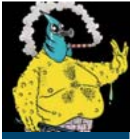
Alternativo Il logo della manifestazione